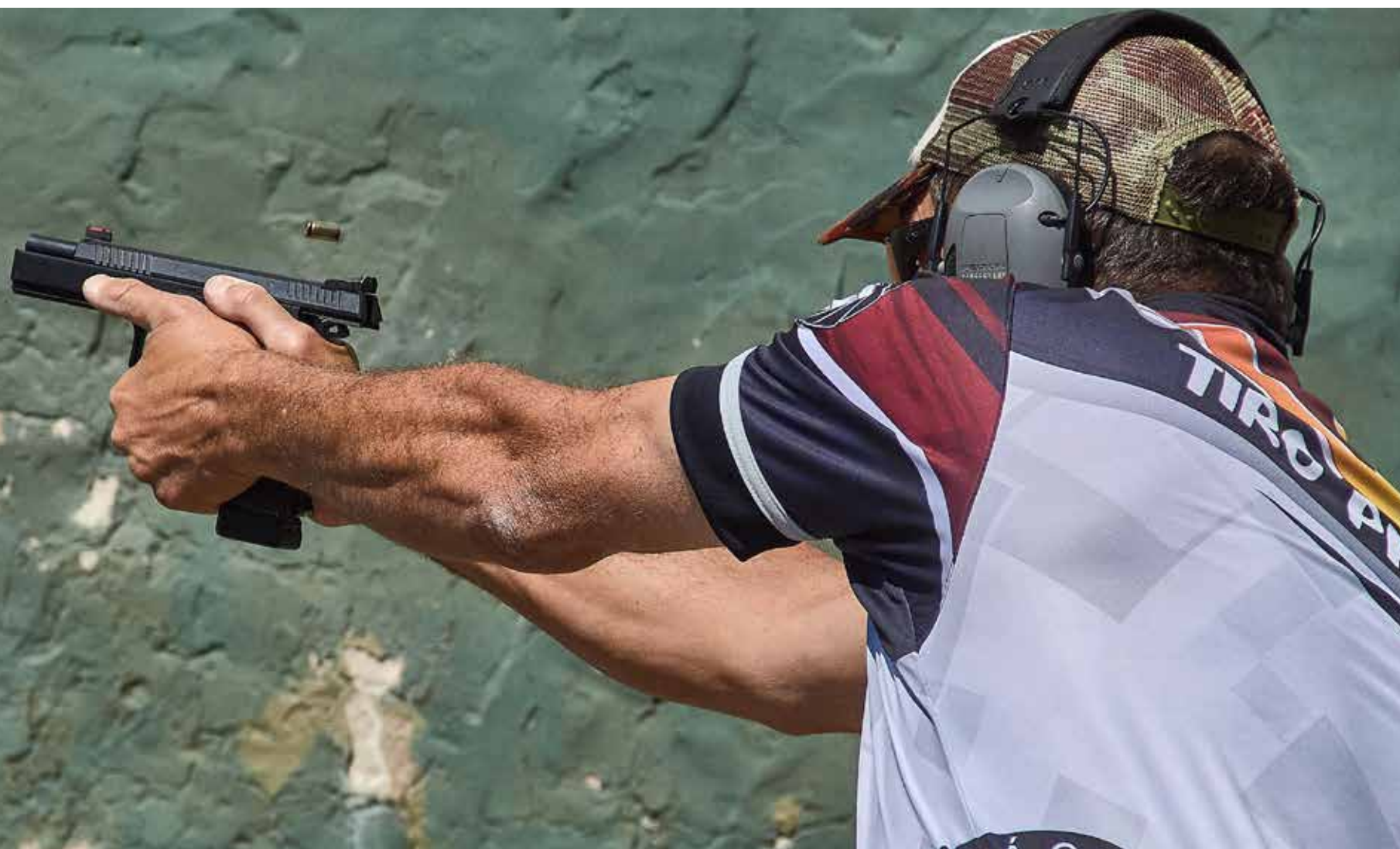
Nacional de IPSC. División Producción. CZ Shadow 2

AB: Exacto. Por eso al tirador que recién empieza, o tiene 2 meses de entrenamiento, le pones un cartón a 5 metros y